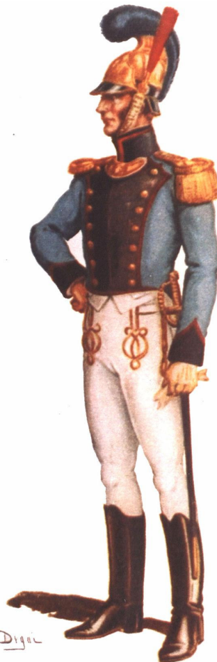
Ufficiale della Compagnia Pompieri di Milano nel 1812 in una superba tavola del Degai.

I fatti dell'incendio di cui sopra, spinsero l'imperatore ad incaricare dei soldati del genio e della Guardia Imperiale di assumere anche le mansioni relative alla difesa dagli incendi nei palazzi imperiali.