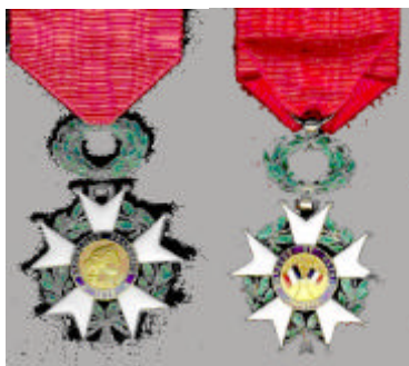
Stella terza repubblica - 1870 - 1940

Sotto il Regime di Vichy (1940), i funzionari dello stato francese sostituirono l'effigie della repubblica con quella del maresciallo Petain.