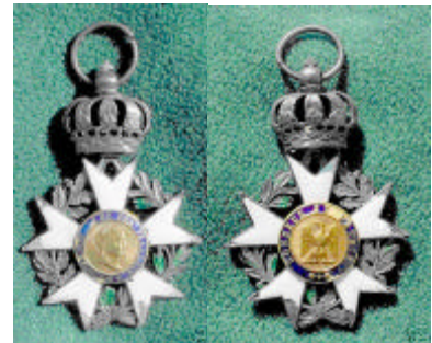
Stella 3° tipo - primo impero 1808-1813

In principio la stella era appesa ad un nastro con un anello. Dal 11 aprile 1806 la stella sarà sormontata da una corona imperiale a dodici braccia, fissata e saldata a due punte superiori della stella (stella di secondo tipo). La saldatura era fragile e questa corona fu rapidamente rimpiazzata da una corona mobile. A partire dal 1 marzo 1808, il diametro aumenta così come il volume del fogliame che contorna la stella e viene sormontata da una corona mobile a otto braccia (stella di terzo tipo). Verso il 1813 le punte delle cinque braccia furono delimitate da piccole palline, per evitare che potessero rovinare le uniformi e gli abiti da cerimonia (stella di quarto tipo).