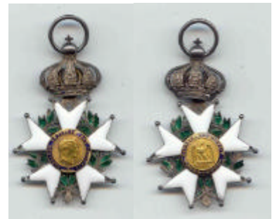
Stella 4° tipo - Primo Impero (1813 - 1814) o dei 100 giorni (1815)