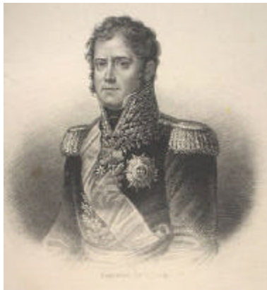
Il maresciallo Michel Ney in una stampa dell'epoca

Nel 1853 sul luogo della fucilazione venne innalzato un monumento, ma la sua tomba (con inciso solamente il cognome) fu sempre trascurata e lo stesso Luigi Napoleone disse che qualcun altro potrebbe esservi sepolto al posto di Michel Ney.